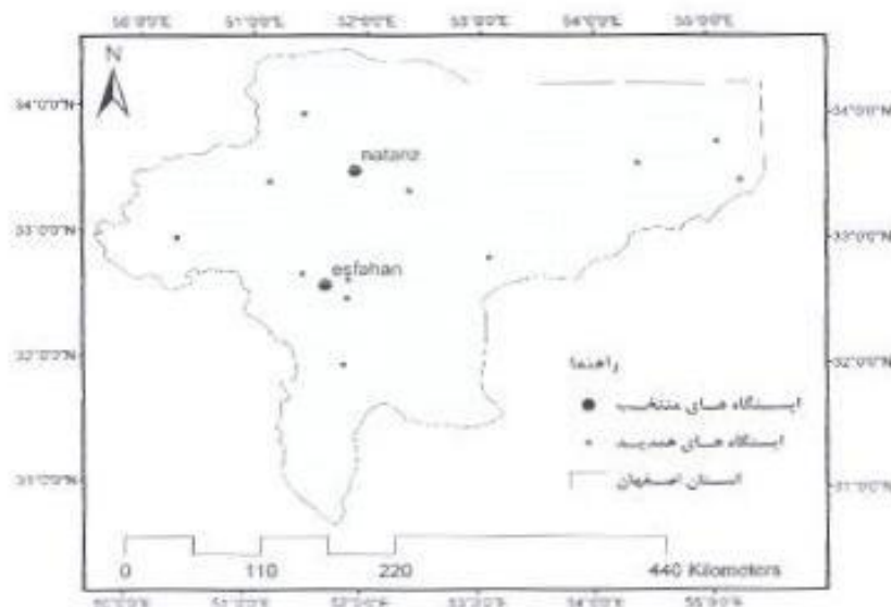
شکل (۱) منطقه مورد مطالعه و ایستگاه‌های همدید منتخب

در این پژوهش از داده‌های رطوبت خاک ۱۱ سنجنده AMSR-E ۱۲ ماهواره Aqua برنامه EOS ۱۳ سازمان فضایی NASA ۱۳ استفاده شده است. این داده‌ها از ژوئن ۲۰۰۲ با اندازه تفکیک مکانی ۲۵ کیلومتر و اندازه تفکیک زمانی روزانه موجود هستند. آدرس دسترسی به این داده‌ها عبارت است از: ( https://wust.ecgi.basa.giv/api/ ). همبستگی این داده‌ها با داده‌های میدانی بارندگی دو ایستگاه همدید اصفهان و نطنز به طریق پارامتری بررسی شده است (شکل ۱).