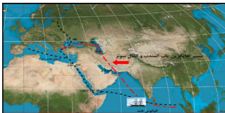
شکل ۴- مسیر جایگزین دریایی آسیا، سوئز، اروپا از طریق کریدور ایران ولگا

از جمله تفاوت‌های اساسی دیگر در آمایش متداول و بنیادین روش‌های تحقیقات آمایشی است. روش تحقیق در آمایش متداول بیشتر متکی به روش‌های کمی و عقلانیت ابزاری است که در دنیای علمی امروز تقریباً مندرس و روش‌های تفسیری، و تاویلی جایگزین آن می‌شود. ۱ این تفاوت‌ها بیشتر در مبانی کشورشناسی ایران نمود می‌یابد. در آمایش بنیادین، ایران سرزمینی متکثر با هویتی واحد خوانده شده که پخشیدگی ۲ رکن توزیع جمعیت انسانی در آن است و آنچه تحت عنوان تنوع زبانی، قومی و... در ایران مطرح است را بر اساس قانون تنوع ۳ ، عامل وحدت ایران می‌داند، حال آنکه در اصول آمایشی متداول وجود تنوع قومی، زبانی، مذهبی معمولاً عامل چالشی و واگرایی تلقی می‌شود. همچنین بر اساس دیدگاه‌های تاویلی در آمایش بنیادین موقعیت جغرافیای ایران نه تنها بستر مناسبی برای شکل گیری تمدنی دریا پایه و خشکی پایه که به عنوان تغییردهنده ژئوپلیتیک منطقه و تغییر اهمیت خط سیاسی اقیانوس هند، باب المندب، سوئز به محور دریای عمان، خزر، ولگا اروپا معرفی می‌شود (شکل ۲، ب). به تعبیری دیگر آمایش بنیادین معتقد است، استناد به روش‌های تجربی صرف و عقلانیت ابزاری در آمایش متداول سبب شده که بسیاری از روابط فضایی پنهان، در مطالعات ملحوظ نشود و این موضوع عدم شکل گیری یک نظریه بنیادین سرزمینی را سبب شده است. بدون تردید نداشتن نظریه‌ای اساسی در آمایش یک سرزمین سبب می‌شود که به طور غیرمتعارف تغییر در سیاست‌ها رخ دهد و فعالیت‌های دوره‌های زمانی بجای تقویت و پشتیبانی کردن از یکدیگر همدیگر را خنثی و سبب ائتلاف منابع و از دست رفتن فرصت‌های زمانی شود.