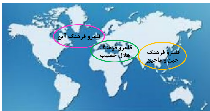
شکل ۱- تقسیم‌بندی یوستین اگارد از قلمروهای دانش

به این پرسش به وجود آمده و بیانگر این فهم است که به صورت اجمالی حوزه مدنی ایرانی‌ها با حوزه تمدنی آتن ۱ متفاوت است (شکل ۱) و چون سرزمین و جهان‌بینی آن‌ها متفاوت است، لذا الگوی توسعه آن‌ها نیز متفاوت خواهد بود زیرا نگاه ایرانیان به مسئله سعادت بشری با آن‌ها همسان نیست. اکنون به‌طور قاطع می‌توان گفت، ایرانیان به صورت اجمالی می‌دانند که نسبت آن‌ها با جوامع پیشرفته امروزی چیست؟ و جهان آن‌ها با جهان‌بینی حوزه تمدن آتنی چه تفاوتی دارد و تاریخ و هویت سرزمینی‌شان چه نقشی در این افتراق‌ها بازی کرده و می‌کند.