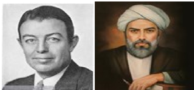
شکل ۲- الف، صدرالمتالهین، ب، بنجامین لی ورف

ورف معتقد است هر جامعه‌ای می‌تواند دستگاهی زبانی و فرهنگی را شامل شود که نوع فهم و ادراک آن جامعه از محیط و جهان به آن بستگی خواهد داشت.