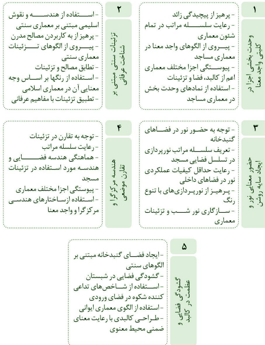
شکل ۳) نتایج حاصل از کدگذاری انتخابی

مرحله اصلی در نظریه‌پردازی داده مبنا، کدگذاری انتخابی است. در فرآیند پژوهش با کدگذاری انتخابی نظریه پژوهش روشن شد و ارتباط نظام‌مند مقوله محوری با دیگر مقوله‌ها در چارچوب یک روایت، روشن شد. در این مرحله پژوهشگران بر اساس فهم خود از متن پدیده مورد مطالعه، روایتی عرضه کردند. به این منظور، نحوه اسم‌گذاری و کدگذاری انتخابی بر اساس مفهوم‌پنداری و رای بالای ۵۰٪ آرا صورت پذیرفت.