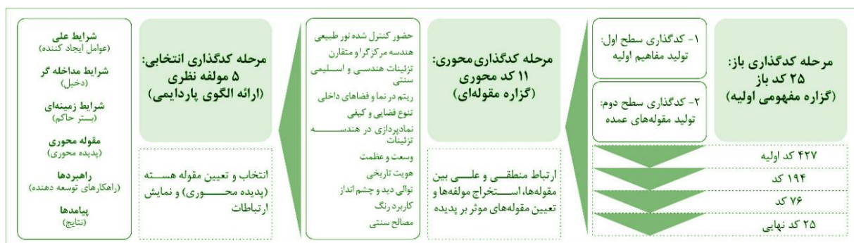
شکل ۱) مراحل کدگذاری باز، محوری و انتخابی

به‌منظور افزایش دقت و تحلیل دقیق‌تر یافته‌ها، فرآیند کدگذاری داده‌ها از دو مسیر مجزا، اما به موازات هم، یعنی کدگذاری دستی و کدگذاری نرم‌افزاری انجام شد و در نهایت نتایج حاصل از دو مرحله برای ترسیم مدل نموداری تدوین نظریه در «نظریه داده بنیاد» ترکیب و تبیین شدند. شکل ۱ فرآیند و نتایج پژوهش را تا به اینجا ارایه می‌کند و در شکل ۲ نمودار مؤلفه‌های مؤثر بر ایجاد احساس معنویت در مساجد جامع تبیین شد.