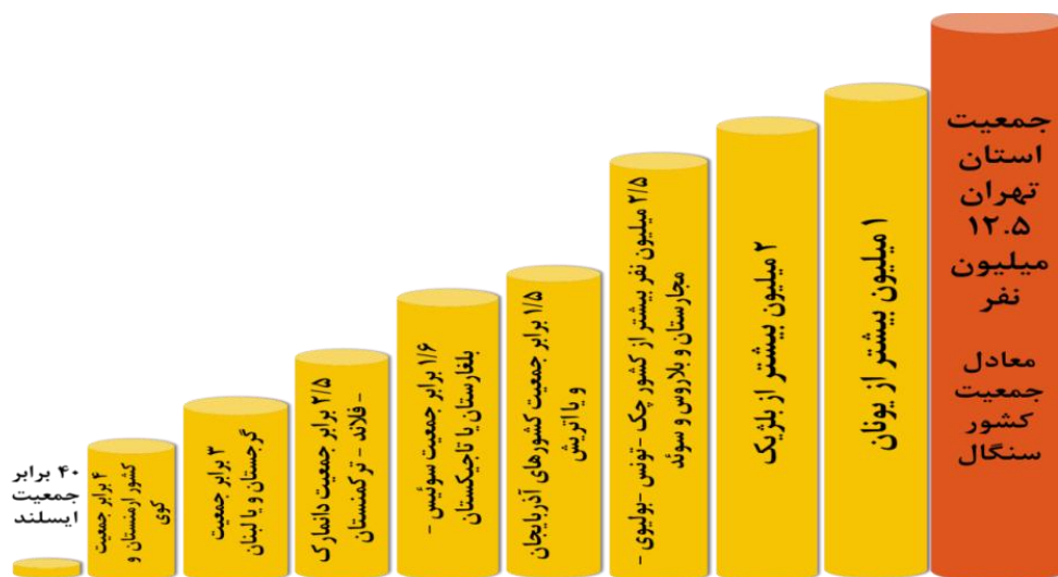
شکل ۱- مقایسه جمعیت تهران با سایر کشورها

سوال این است آیا ساختارهای اداره تهران (استان و یا تهران بزرگ یا شهر تهران) در حد ساختارهای یک کشور هست؟ آیا لازم است برای اداره تهران به ساختارهایی در حد یک کشور مثلاً سوئد، نروژ یا لبنان رسید؟ یا برعکس باید ساختارهای فعلی را نیز محدود و کوچک کرد.