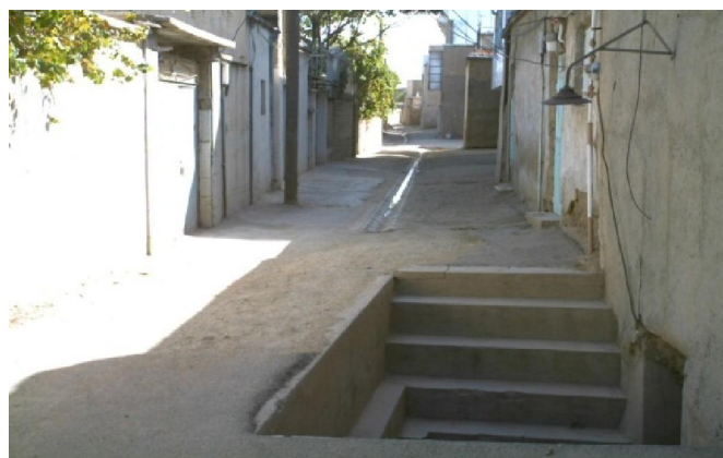
شکل ۲) تصویر پیش‌آمدگی ورودی منازل در معبر