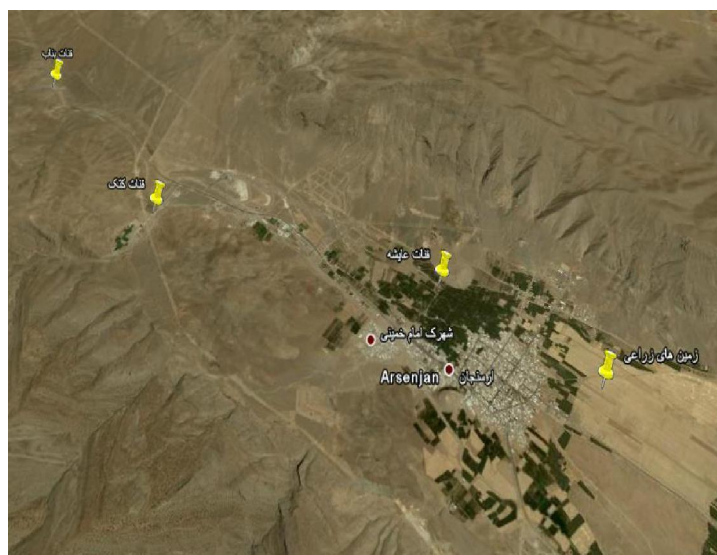
شکل ۲) تصویر ماهواره‌ای کاریزهای آرسنجان و زمین‌های زراعی تحت پوشش، (منبع: شرکت دیجیتال گلوب، سازمان زمین-شناسی ایالات متحده آمریکا، ۲۰۱۳)

نگاهی به ویژگی‌های فیزیکی و آبدهی کاریزهای آرسنجان نشان می‌دهد کاریزهای آرسنجان که گردانندگی، بهره-برداری و پخش آب آن به شیوه تعاونی و همیاری همگانی است، دارای سه رشته کاریز به نام‌های عایشه، بناب و کتک