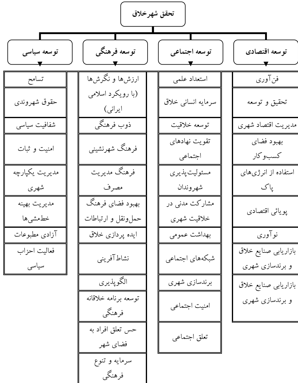
شکل ۳- شاخص‌های توسعه شهر خلاق اصفهان