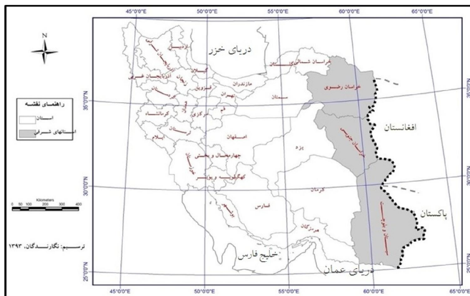
شکل ۱) مرزهای شرقی کشور در همسایگی کشورهای افغانستان و پاکستان

که با وزندهی به موارد مورد نظر به تکمیل ماتریس سوات منجر شد و در ادامه، راهبردهای مناسب برای آمایش مناطق مرزی شرق کشور ارائه گردید. در نهایت نیز برای مشخص شدن اولویت راهبردها از ماتریس برنامه‌ریزی استراتژیک کمی ۲ استفاده شد و براساس آن اولویت هر یک از راهبردها مشخص گردید.