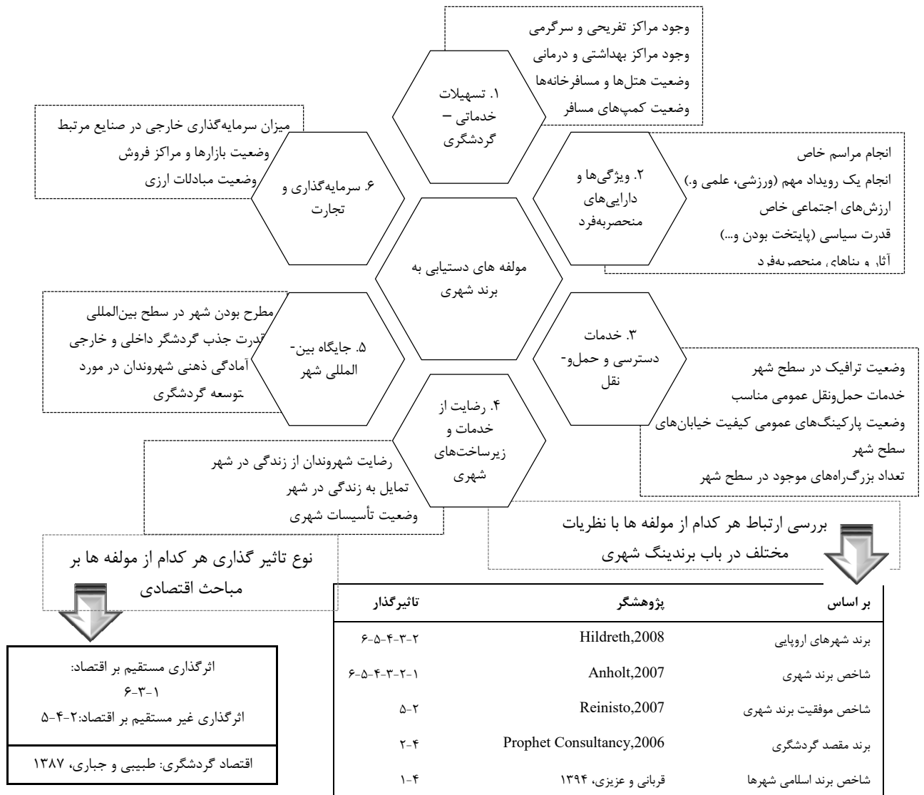
شکل ۴- مؤلفه‌ها و شاخص‌های دستیابی به برند شهری مطلوب

طبق جدول موجود در شکل ۴، هر کدام از این شاخص‌ها بر اساس نظریات متخصصین مختلف می‌باشد (Hildreth, 2008, Anholt, 2007, Reinisto, 2007, Prophet Consulty, 2006, (قربانی و عزیزی، ۱۳۹۴). نوع تأثیرگذاری بر مباحث اقتصادی برای هر کدام از شاخص‌ها نیز در این جدول نشان داده شده است. با توجه به پژوهش صورت گرفته توسط (طیبی و جباری، ۱۳۸۷) در رابطه با اقتصاد گردشگری، مؤلفه‌های سرمایه‌گذاری و تجارت، تسهیلات خدماتی و گردشگری و خدمات حمل‌ونقل و دسترسی مناسب، تأثیر مستقیم بر اقتصاد دارند. هر کدام از این مؤلفه‌ها، شاخص‌هایی دارند که در شکل ۵ نشان داده شده است.