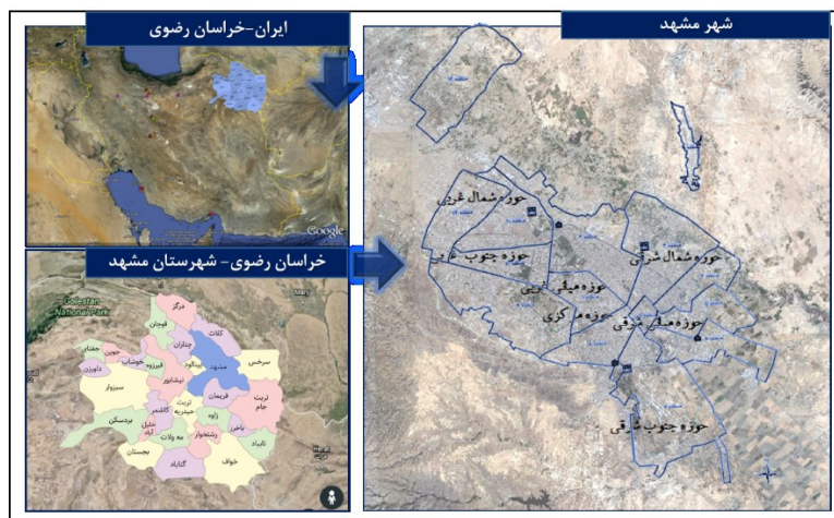
شکل ۱- موقعیت جغرافیایی شهر مشهد

کلان‌شهر مشهد به جهت وجود بارگاه حضرت امام رضا(ع)، یکی از مقصدهای عمده مذهبی ایران و حتی جهان است و هر ساله به‌ویژه تعطیلات (اعیاد و سوگواری‌ها)، شاهد حضور میلیون‌ها گردشگر مذهبی (زائر) است. طبق آمار تعداد زائرین شهر مشهد در سال ۹۳ معادل ۲۲ میلیون نفر بوده است (هاشمیان، ۱۳۹۴: ۴).