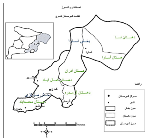
شکل ۱) تقسیمات سیاسی شهرستان کرج [سالنامه آماری استان البرز، ۱۳۹۴]