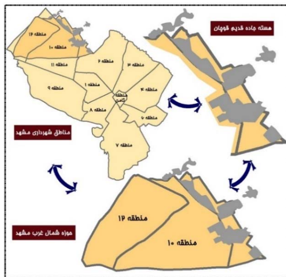
شکل ۱) جایگاه هسته جمعیتی جاده قدیم قوچان در کلانشهر مشهد

مالکیت زمین‌های محور قدیم قوچان ملکی و آستانه بوده و غالب واحدهای مسکونی آن کم‌دوام است. ارزانی زمین، عدم پرداخت مالیات و عوارض شهرداری و مساعدبودن منطقه برای جذب مهاجر، علت‌های اصلی گسترش این هسته را رقم می‌زند. بررسی وضعیت اجتماعی و مدیریتی این هسته نیز حکایت از ضعف مشارکت سازمان‌های مردم‌نهاد و تشکل‌های مردمی در توانمندسازی بافت و طرح‌های توسعه شهری دارد (شکل ۱).