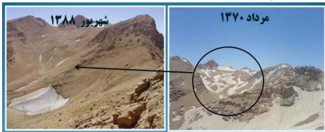
شکل ۱) تفاوت سطح در بخشی از یخچال های اشتران کوه در مرداد ۱۳۷۰ و شهریور ۱۳۸۸ (مؤسسه تحقیقات آب، ۱۳۸۸)

در این خصوص توسط Mousavi و همکاران (۲۰۰۹، ۹۳)، انجام شد که در آن از تصاویر ماهواره ای استفاده گردیده است. این محققین فهرست برداری جدیدی از یخچال های کشور ارائه دادند که نهایتاً سطح کل را حدود ۲۷ km ۲ محاسبه نمودند. وجود اختلاف در سطوح اعلام شده تا حدی به این دلیل است که بخشی از یخچال های کشور در زیر واریزه ها مدفون هستند که اندازه گیری آنها را با مشکل مواجه می کند. از سوی دیگر زوال آنها در فاصله زمانی دو تحقیق می تواند عامل دیگری باشد که در گزارشات مختلف به آن اشاره شده است (Ferrigno, ۱۹۹۱ و وزیر، ۱۳۸۲).