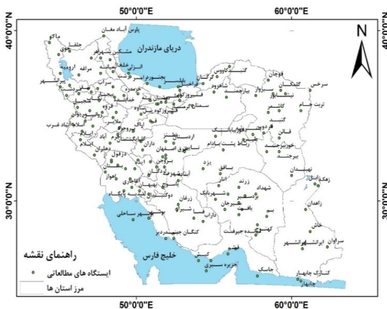
شکل ۱- پراکنش ایستگاه‌های مطالعاتی بر گستره ایران

به منظور بررسی قانونمندی فضایی حاکم بر شاخص اقلیم گردشگری در عرض‌ها و طول‌های جغرافیایی و همچنین ارتفاعات مناطق مختلف، داده‌های اقلیمی ۱۵۳ ایستگاه سینوپتیک هواشناسی کشور از بدو تأسیس ایستگاه‌ها تا سال ۲۰۱۰ مورد توجه قرار گرفته است. نواقص آماری ایستگاه‌ها با استفاده از روش همبستگی تکمیل گردید. پراکنش ایستگاه‌ها بر گستره ایران در شکل ۱ نشان داده شده است. با توجه به اینکه هدف این مقاله بررسی تأثیر مشخصات جغرافیایی عرض، طول و به‌ویژه تغییرات ارتفاعی مناطق مختلف کشور بر روی یک شاخص اقلیم آسایش گردشگری بوده و شاخص اقلیم گردشگری تقریباً عمده‌ترین عوامل اقلیمی را به‌عنوان ورودی در نظر می‌گیرد لذا این شاخص جهت مدل‌سازی سه‌بعدی در نظر گرفته شد. میچکوفسکی (۱۹۸۵) این شاخص را نه تنها برای عرض‌های جغرافیایی بالا بلکه برای عرض‌های متوسط نیز پیشنهاد و به کار گرفت.